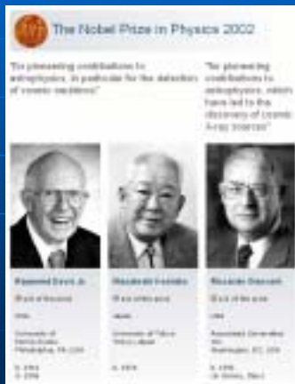
2002年のノーベル賞受賞者

1987年にマゼラン雲で発生した超新星 1987Aのニュートリノを検出し、ニュートリノ 天文学の第一歩を記した