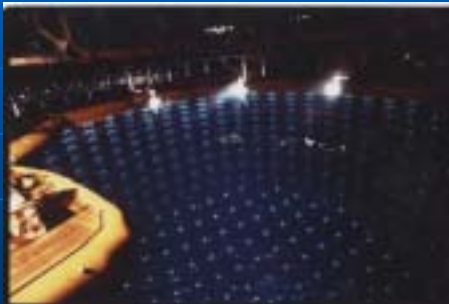
カミオカンデの純水タンク

1987年にマゼラン雲で発生した超新星 1987Aのニュートリノを検出し、ニュートリノ 天文学の第一歩を記した