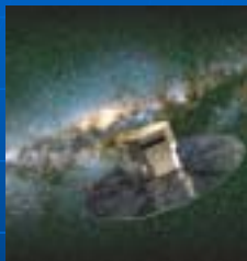
GAIA (ヨーロッパ) 2013年打ち上げ