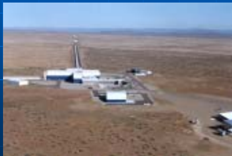
LIGO (米国 Caltech & MIT)