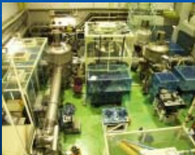
TAMA300 (国立天文台 他)