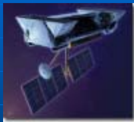
SIM (アメリカ) 2015年打ち上げ