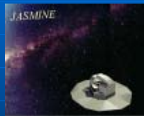
JASMINE (日本) 2015年打ち上げ